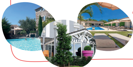
Quelques-uns de nos hôtels partenaires