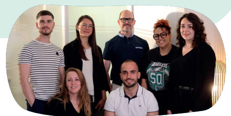
Votre équipe dédiée au PFS

L'année à venir s'annonce prometteuse. Nous continuerons de repousser les limites de l'innovation et de développer des compétences pour répondre aux besoins en constante évolution du secteur. Ensemble, avançons vers un avenir toujours plus inspirant et performant.